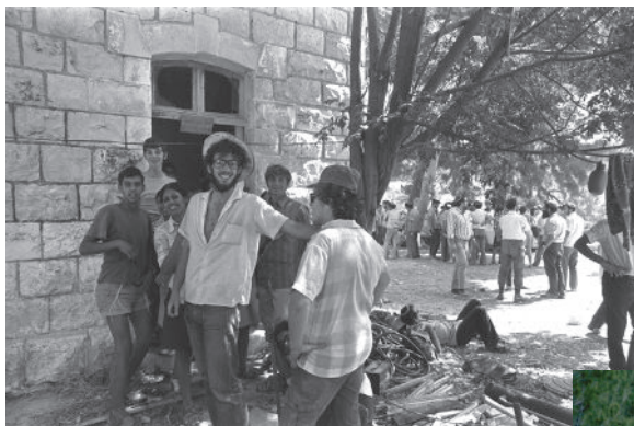
בני עקיבא. חניכי התנועה במועדון מאולתר, אלון מורה, 1974