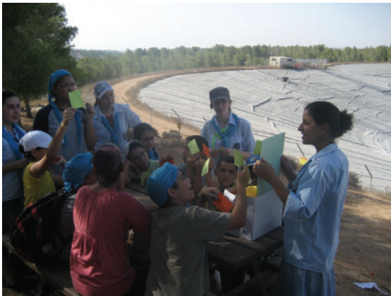
בני עקיבא. פעילות קיץ