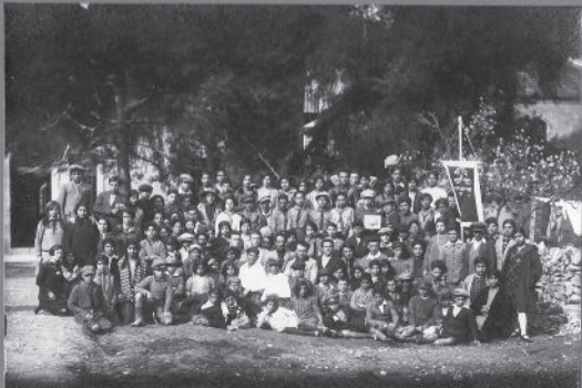
בי"ס לנוער העובד על יד ועדת התרבות, ירושלים בהגירת פר' בשבט התרפ"ח. Educational Committee's Young Worker's School Jerusalem. The feast of 15 th of Sh'vat 1928.