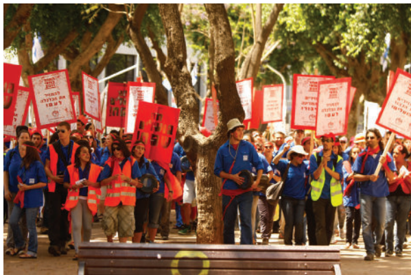
המחנות העולים. שירות בקהילה