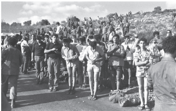
בני עקיבא. תפילה מול מחסום צה"ל ליד רמאללה, 1974