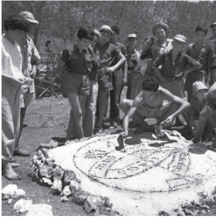
הנוער העובד. מחנה קיץ, שנות ה-40