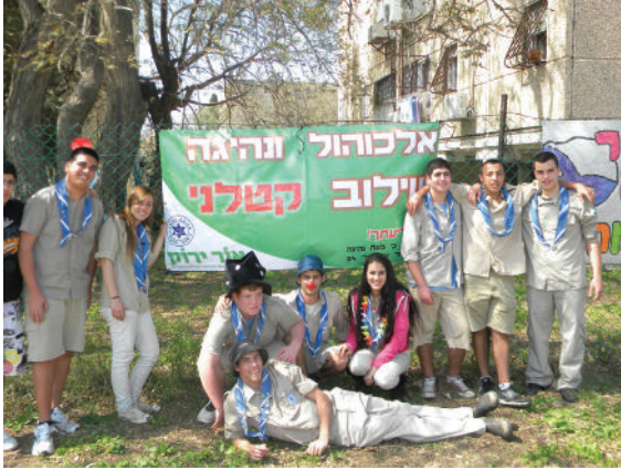
מכבי הצעיר. מתנדבים למלחמה בתאונות הדרכים ארכיון מכבי הצעיר