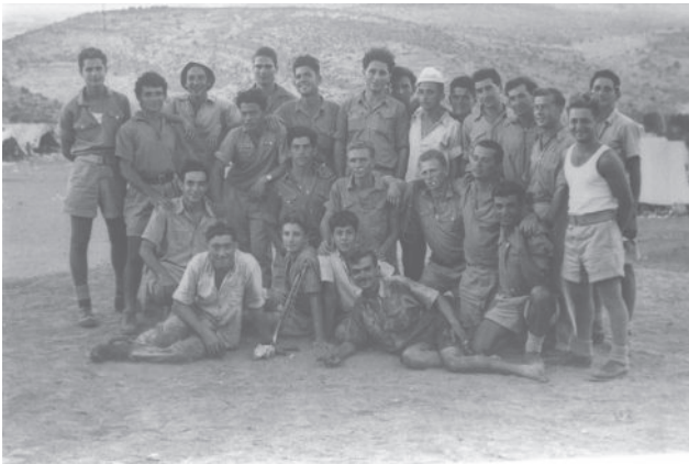
הנוער העובד. שמעון פרס עם חניכי התנועה במחנה קיץ,

ההגשמה אינה רק שלב בחיים. הגשמה משמעה בחירה בדרך חיים. גם בנושא זה לא התקבלו החלטות שמשנות את פני הדברים. גם כאן יוצאת מן הכלל תנועת הצופים, בהקמת גרעיני שנת שירות וגרעיני נח"ל שאינם מגשימים בקיבוץ, אולם החלטות עדיין לא שונות.