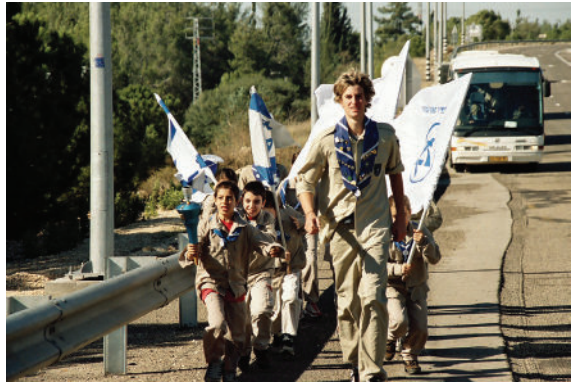
מכבי הצעיר. מירוץ הלפיד, חנוכה ארכיון מכבי הצעיר