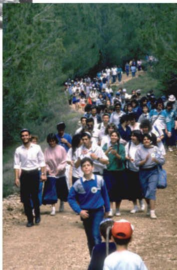
בני עקיבא. צעדה בגוש עציון, 1988