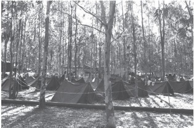
צופים, ג'מבורי 1973