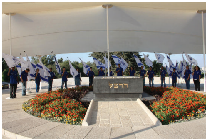
הנוער הלאומי. טקס בהר הרצל, מול קבר הרצל