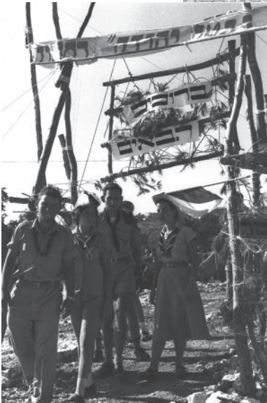
צופים. ג'מבורי 1973. בונים מבנה שבטי אוסף התצלומים הלאומי; צלם: הרמן חנניה