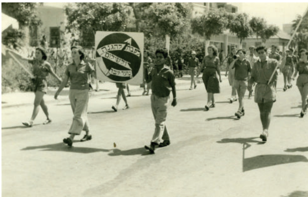
הנוער העובד. תהלוכת אחד במאי, שנות ה-50, הרצליה