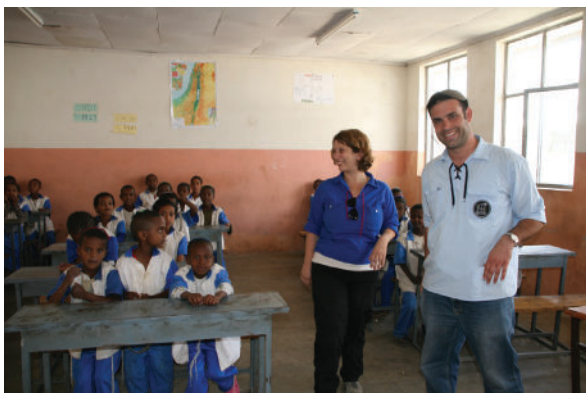
מלמדים בכיתה באתיופיה. משלחת חלוצה, הנהגות תנועות הנוער באתיופיה, 2011