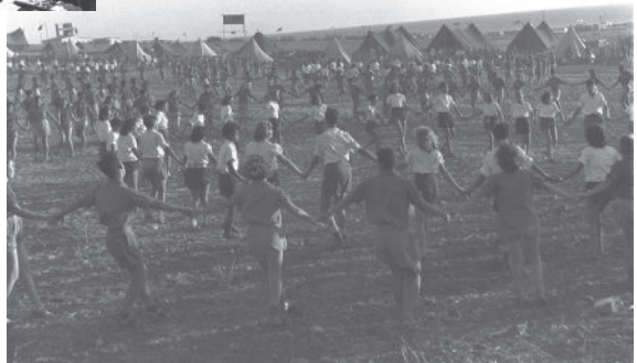
השומר הצעיר. ריקוד הרונדו בשומריה, 1941