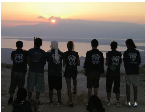
המחנות העולים. טיול שכבה בוגרת ארכיון המחנות העולים