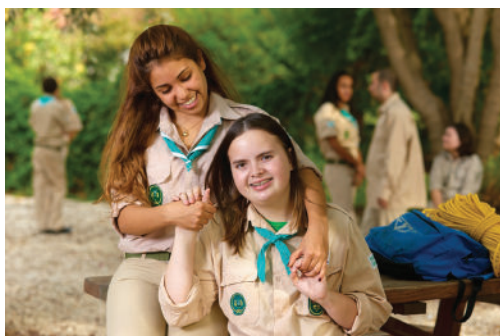
הצופים. צמי"ד (צרכים מיוחדים). שירות בקהילה