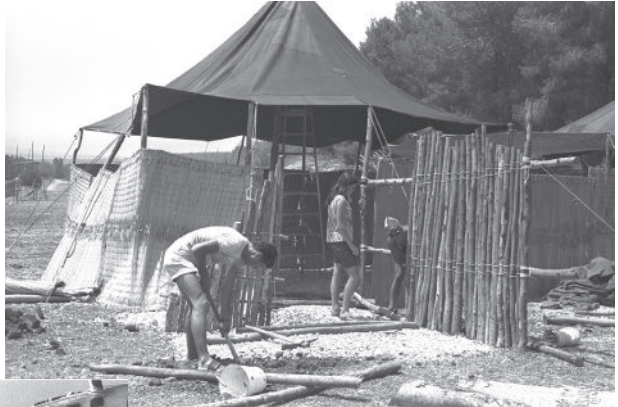
צופים. ג'מבורי עשירי. בניית אוהל מרכזי