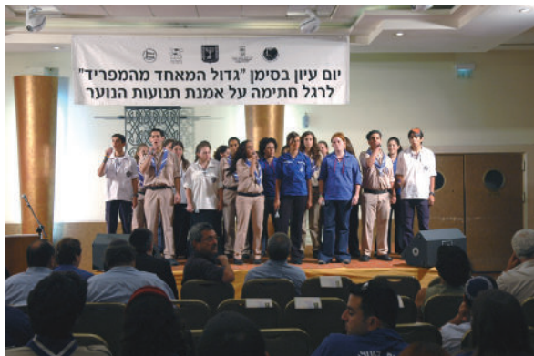
להקת תנועות הנוער, חתימת אמנת תנועות הנוער, 2005