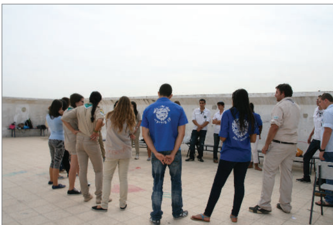
יום תנועות הנוער, הדרכה משותפת לכמה תנועות, נתניה, 2012