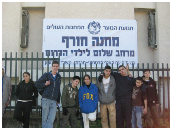
המחנות העולים, מחנה חורף לתושבי הדרום, במבצע עופרת יצוקה, 2009-2008